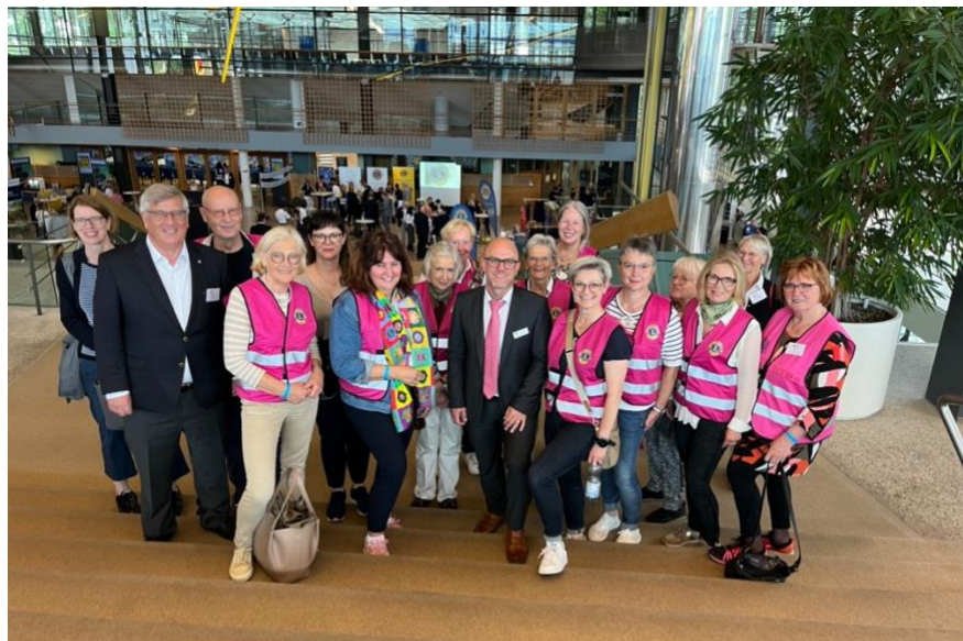
3.000 Schritte für die Gesundheit. Nachahmer werden gesucht.