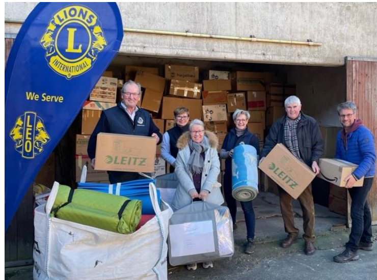
Schlafmaterial und Kleidung für ukrainische Flüchtlinge in Polen.