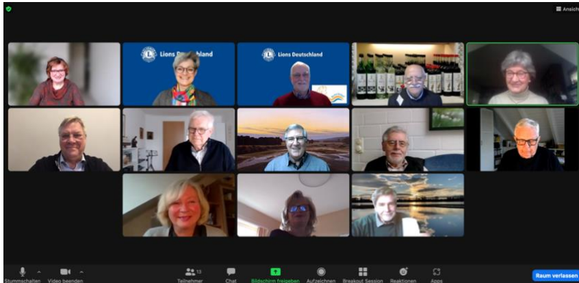
Regel Austausch im Seminar für Seniorenbeauftragte.

Am Freitag, den 19. Februar starteten die zehn parallel durchgeführten Seminare für Präsidenten, Sekretäre, Schatzmeister, Activitybeauftragte, Beauftragte für Lions-Quest, Neumitglieder, Seniorenbeauftragte, Beauftragte für PR und Webmaster, Leo-Club-Beauftragte sowie