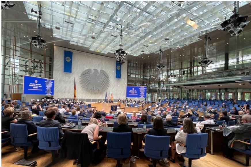
Multidistriktversammlung gut besucht im ehemaligen Plenarsaal des Deutschen Bundestages.

Nach zwei Jahren im digitalen Format auf Abstand, war das Interesse am persönlichen Treffen der Lions in diesem Jahr enorm. Über 800 Besucher zählten die Veranstalter an den 4 Tagen beim Kongress der Deutschen Lions in der ehemaligen Bundeshauptstadt. Das vielfältige Programm zum Thema Nachhaltigkeit bot nicht nur wertvolle Informationen und Impulse für