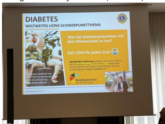
Diabetesprävention als Lions-Schwerpunktthema.