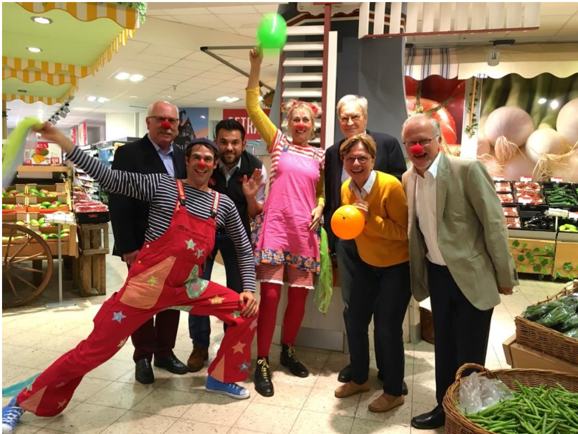
Klinikclowns im Supermarkt- Spendenaktion Bücherwagen des LC Bremen Bremer Schlüssel