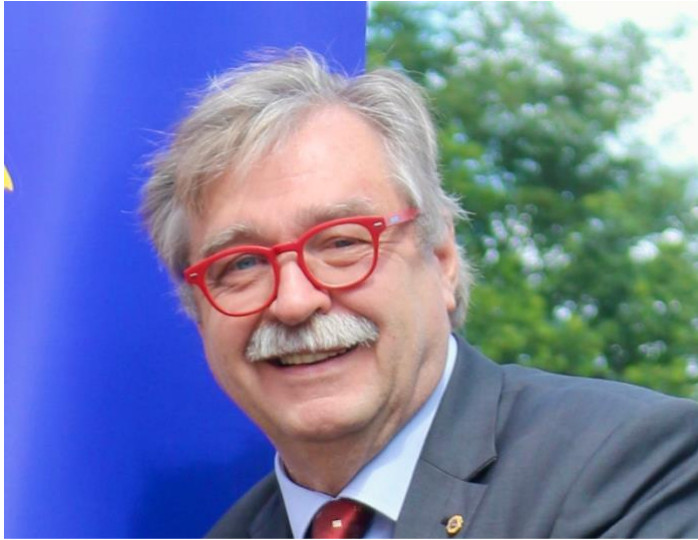
3. VG Uwe Bornkeßel, LC Bremer Schlüssel

Text und Foto: Uwe Bornkeßel, 3. VG, LC Bremer Schlüssel