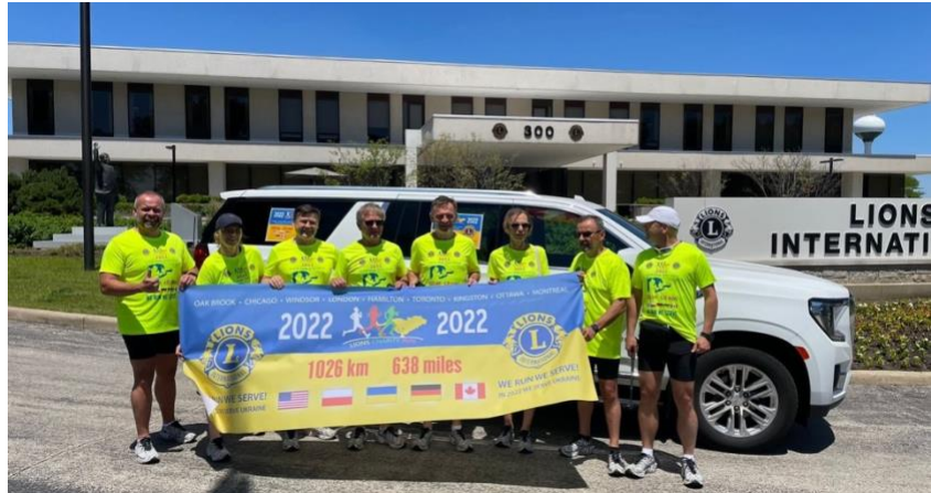
Start des Lauf-Teams vor dem Lions Hauptsitz in Oak Brook.

Montreal war auch das Ziel der 8 Läuferinnen und Läufer des 10. Lions Charity Run.