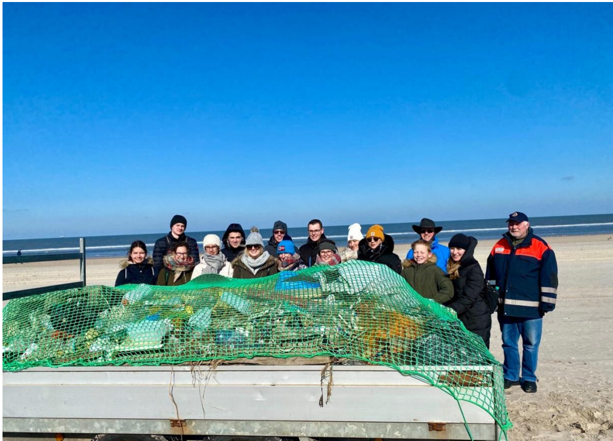
Leos sammeln 1.500 kg Müll am Norderneyer Strand

Am Wochenende vom 04.-06. März fand die Distrikt-Activity unseres Distriktes NB/NW auf der wunderschönen Nordseeinsel Norderney statt. Gemeinsam mit unserer KLEO aus NW, die von Norderney kommt, haben wir dieses Wochenende organisiert. Bereits auf der Fähre zur Insel kamen die meisten Teilnehmer zusammen. Nach fast 2 Jahren, in denen wir größtenteils ohne persönlichen Leo-Kontakt auskommen mussten, war die Freude über ein gemeinsames Wochenende riesig.