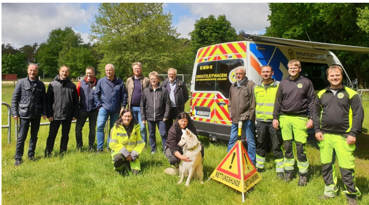
Rettungshundestaffel Cuxhaven demonstriert den Lions ihre Arbeit.

Über private Förderer und interessierte Hundefreunde freut sich der Verein der Rettungshundestaffel aber auch. Weitere Informationen unter www.rhs-cuxland.de .