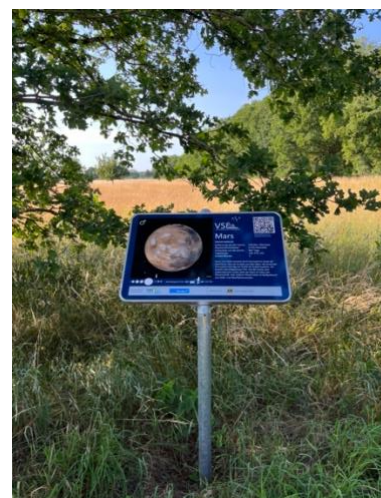
Schautafel mit Informationen und QR-Code.

https://www.volkssternwarte-langwedel.de