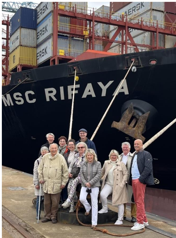
Ausflug zum Eurogate Terminal in Bremerhaven.

Neben anderen Besuchen der Berliner Gruppe in der Cuxland-Region und Bremerhaven, war die Führung durch die Hafenanlagen der Höhepunkt. Die Hauptstädter sind zwar viel Großes in ihrer Stadt gewöhnt, doch so eine Hafenanlage gibt es in Berlin nicht. Im Rahmen der Witze über den Mängel-behafteten BER-Flughafen, war es sehr schön, dass es auch große, aber gut funktionierende technische Anlagen hier an der Weser gibt.