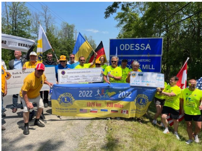
Spendenübergabe in Odessa/Kanada.