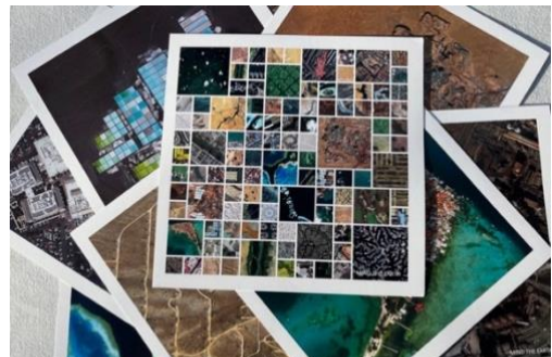
Kartenset Mind The Earth war beim Quiz zu gewinnen.

Als Schmanagerl wurde zum Abschluss eines jeden Seminars ein kleines Quiz gestartet, um die erlernten Inhalte in lockerer Form zu „überprüfen“. Die jeweiligen Gewinnerinnen und Gewinner freuen sich nun über einen Kartensatz der Klimaausstellung „Mind The Earth“, welche im März in Bremen und im Juni in Bremerhaven zu Gast war.