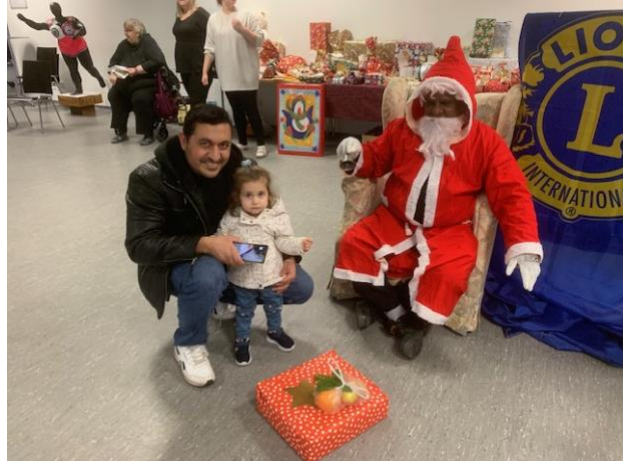
Die Kinder und mit ihnen ihre Eltern freuten sich sehr über die Geschenke.

Diese Aktion hat allen Beteiligten großen Spaß gemacht und gerade in schwierigen Zeiten wie der Coronapandemie und dadurch bedingten reduzierten Sozialkontakten viel Freude bereitet.