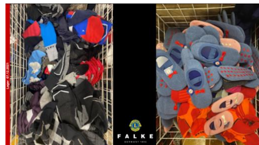
Socken für Bedürftige. Kooperation zwischen Falke und Lions Deutschland.

Für die Bestellung sind Anzahl, Art der Socken (Kinder, Damen, Herren...) sowie die Angabe der künftigen Empfänger der Socken erforderlich. VG Hermann Pribbernow nimmt noch Bestellungen der Clubs unter hermann.pribbernow@kabelmail.de entgegen und gibt weitere Informationen.