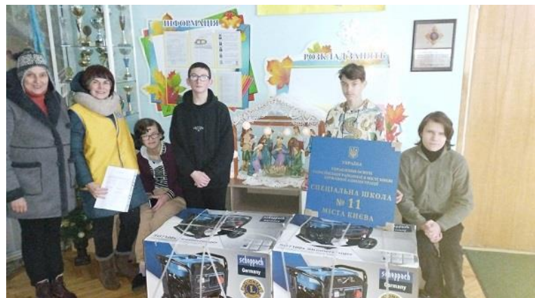
Auslieferung der Generatoren.

Ulf Grundmann, DG 111-MN bringt es auf den Punkt: „Dies ist eine echte Milestone-Activity, die wir Europäer als eine groß angelegte multinationale Lions-Hilfe aus eigener Kraft initiiert und durchgeführt haben. Sie ist eine Blaupause für die Zukunft.“