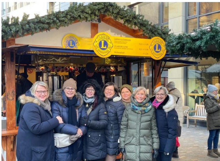
Lions-Freundinnen am Glühweinstand der Bielefelder Lions Clubs.