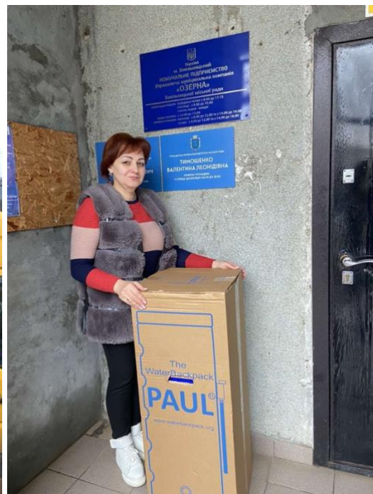
Auslieferung der PAUL Wasserfilter mit Kleintransportern in die Krisengebiete.