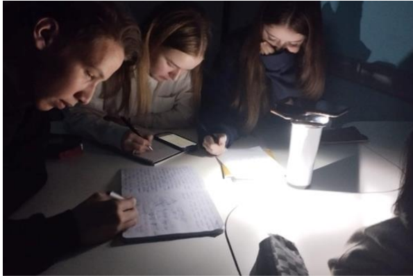
Hausaufgaben im Taschenlampenlicht.