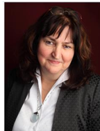
Kabinettsbeauftragte für Interkulturelle Angelegenheiten, Integration Niedersachsen