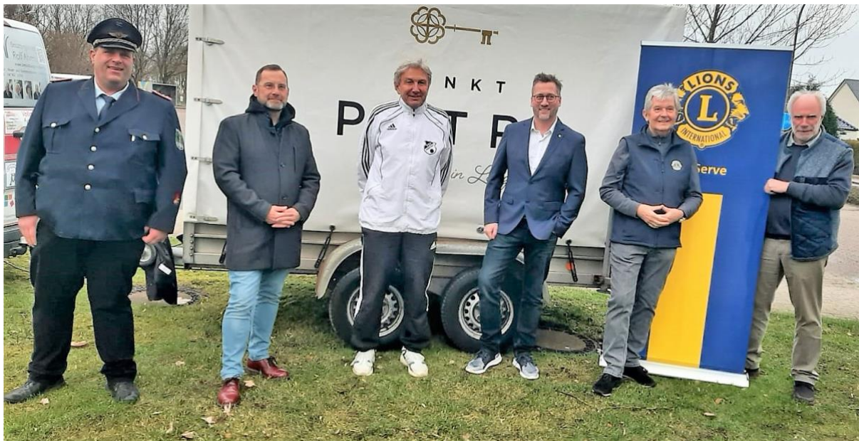
Spendenübergabe aus dem Erlös der 24. Weihnachtsbaum-Recycling-Aktion

Alle Beteiligten des Clubs waren glücklich, dass wir auch in diesem Jahr wieder unsere Jugend im Geestland unterstützen konnten. Wir hoffen, dass die nächste 25. Sammlung wieder unter normalen Verhältnissen durchgeführt werden kann. Die Lions werden nicht nachlassen, dass auch diese Aktion wieder erfolgreich wird.