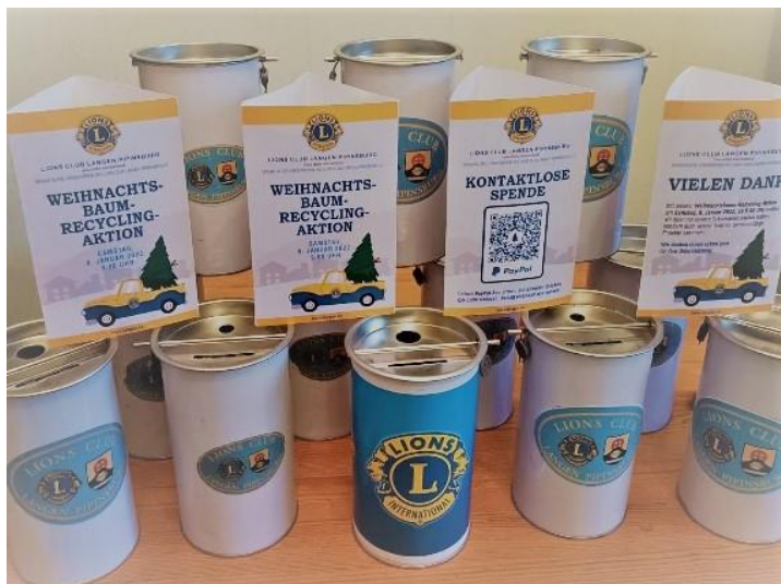
Kontaktlose Spenden via PayPal

Jugendfeuerwehr Langen Handballjugend des TV Langen Kirchenjugend Langen DLRG Langen - Sievern Technisches Hilfswerk (THW) Jugendfeuerwehr Debstedt Jugendabteilung des TSV Debstedt Jugendfeuerwehr Sievern Bürgerfonds der Stiftung Geestland