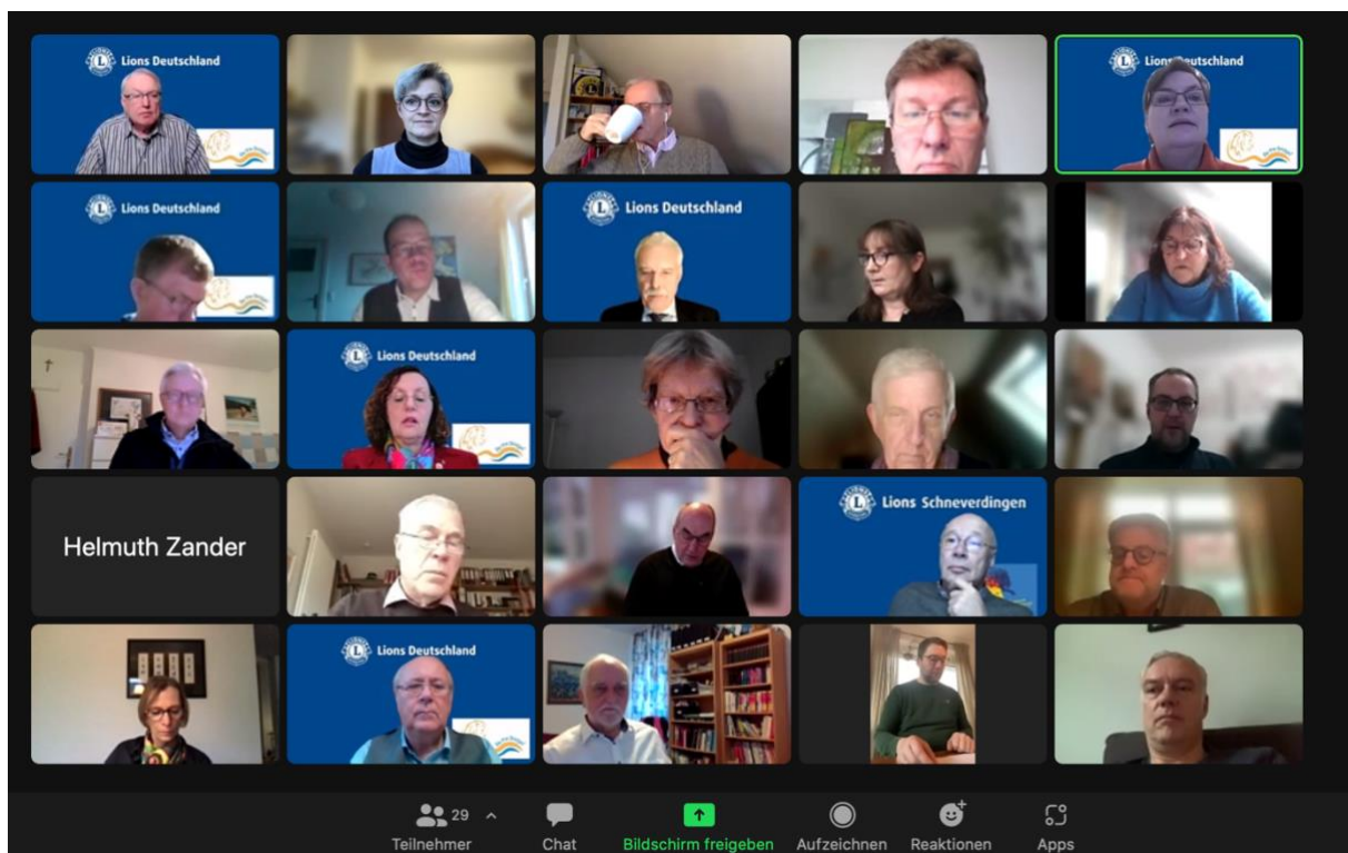
Rege Teilnahme bei der Kabinettsitzung per Zoom.