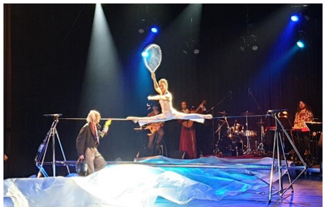
Impressionen der Varieté-Show „Karneval der Tiere“ unterstützt vom LC Nienburg/Weser Cor Leonis