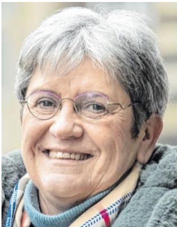
Kabinettsbeauftragte für Interkulturelle Angelegenheiten, Integration Bremen

Eine Eingangsbestätigung erhalten die Clubs umgehend.